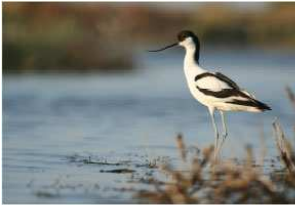
Avocette élégante