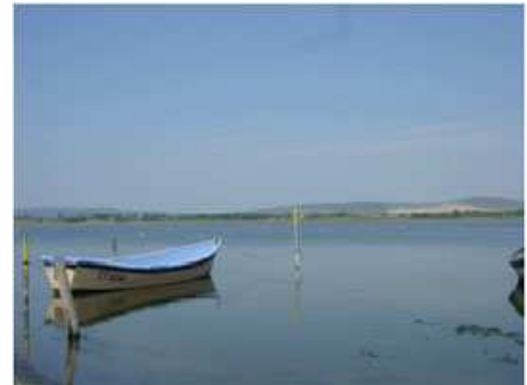
Etang d'Ingril.

Le précédent projet LIFE sur les lagunes méditerranéennes, le projet « Sauvegarde des Étangs Littoraux » , porté par le Conservatoire du Littoral, a permis de renforcer les structures spécifiques de protection et de gestion des espaces lagunaires ; ces structures sont pour la plupart devenues opérateurs des sites Natura 2000 lagunaires qui font l'objet du présent projet.