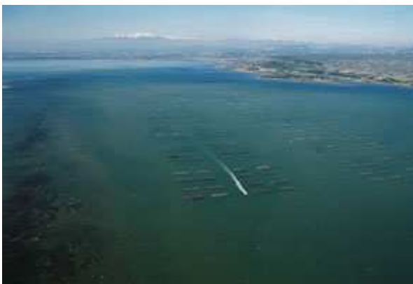
L'étang de Salses-Leucate

Tour du Valat, Office de l'Environnement de la Corse, Atelier Technique des Espaces Naturels (ATEN), Conservatoire du Littoral.