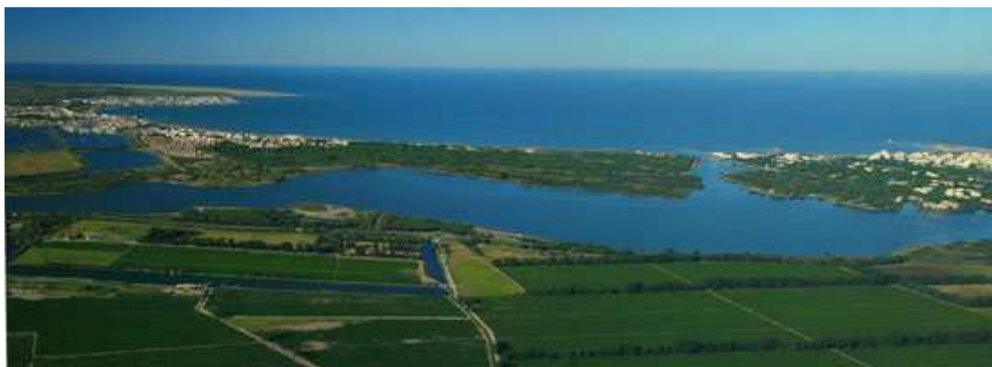
L'étang du Ponant

La mise en place de ce réseau de sites pilotes pourra, tout au long du projet, bénéficier d'échanges au niveau interrégional dans le cadre du Pôle relais lagunes méditerranéennes et au terme du projet s'étendre au niveau européen en envisageant un futur projet européen de type INTERREG sur les lagunes italiennes, espagnoles et françaises.